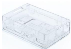
Raspberry Pi 3 Model B in Gehäuse eingebaut